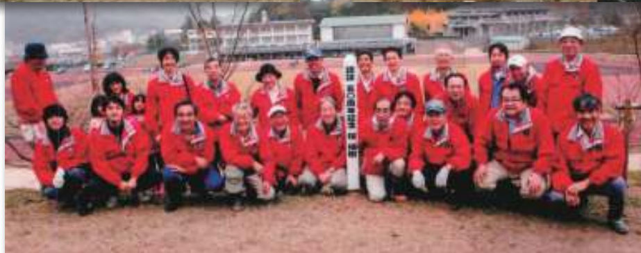
倉吉LC認証50周年記念桜植樹