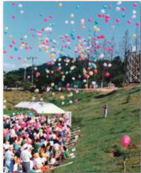
倉吉LC認証30周年記念メタセコイア植樹