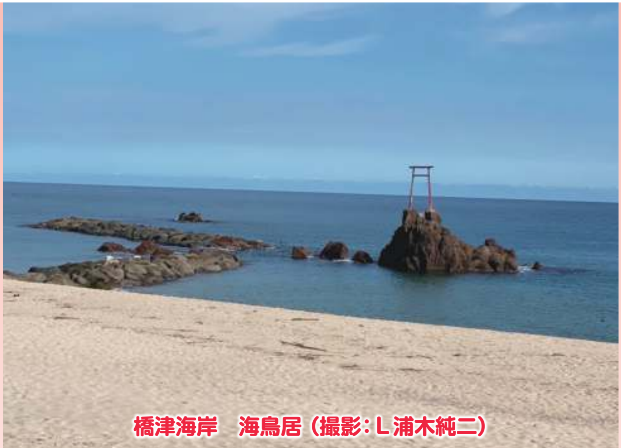
橋津海岸 海鳥居