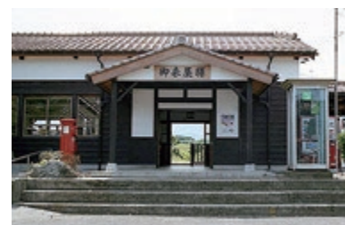
山陰地方最古の駅舎、御来屋駅

たまには、普通列車に駅弁を持ち込み山陰沿線の車窓を眺めながらの列車旅をして、心のリフレッシュをしてみたいかがでしょうか。